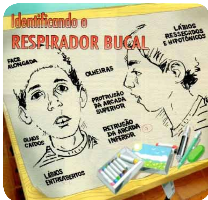
Figura 1 – Identificando o respirador bucal

A respiração bucal é uma queixa frequente nos ambulatórios. É decorrente de obstrução nasal completa ou incompleta, uni ou bilateral. É preciso lembrar que a respiração bucal não é uma doença, e sim uma síndrome com sinais e sintomas característicos e com um grande número de etiologias tanto intrínsecas quanto extrínsecas ao nariz. Por ser um tema vasto, este texto não irá aprofundar todas as enfermidades que levam à respiração bucal e suas complicações. Também será dada ênfase à faixa pediátrica, pois as crianças são os pacientes mais acometidos por essa síndrome e terão as maiores repercussões quando não tratadas adequadamente.