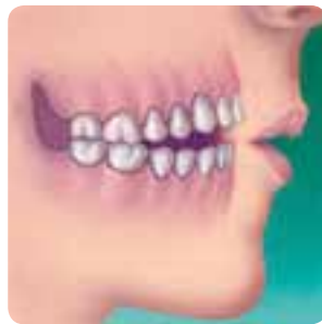
Figura 3 – Mordida aberta

A halitose pode estar presente se restos alimentares e debris estiverem depositados no tecido adenoideano. A olfação estará prejudicada devido à inflamação nasal ou obstrução mecânica da região da placa crivosa. O paciente poderá apresentar voz hiponasal.