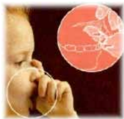
Figura 4 – Sucção digital

Quando os hábitos são interrompidos entre os 24 e 36 meses, há um risco aumentado de desenvolvimento de mordida cruzada e aumento da distância intercanina mandibular, comparativamente com os hábitos que são interrompidos aos 12 meses. A interrupção entre os 36 e 48 meses confere maior prevalência de overjet aumentado, mordida aberta e maior profundidade maxilar em comparação com a cessação do hábito mais precocemente.