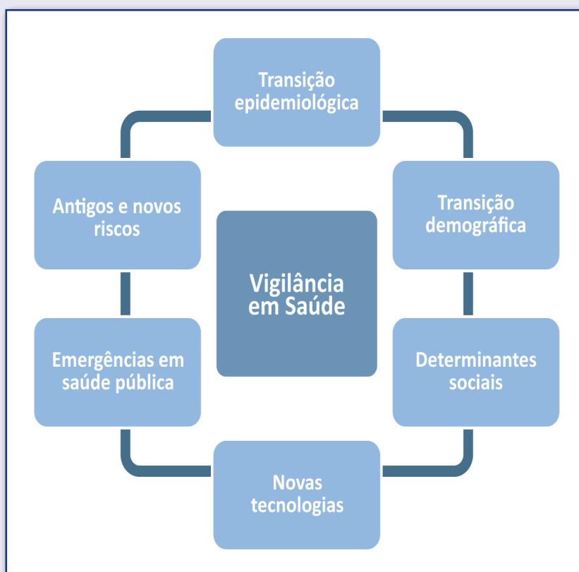
_Fig. 1: Transição paradigmática da vigilância em saúde. (BRASIL, 2013)

O quadro mostra que a prática da vigilância tem sido aprimorada a partir de evidências produzidas, por suas próprias ações, incluindo a observação e uso de informações sobre a magnitude dos problemas de saúde e seus determinantes. As disparidades de risco entre pessoas, entre momentos no tempo e entre regiões distintas, assim como a influência das desigualdades e do contexto social e econômico na saúde das populações brasileiras são essenciais para a interpretações dos fatores que interferem no processo saúde e doença. (BRASIL, 2013). Na figura 1 há destaque para o deslocamento do olhar sobre a doença para o modo de vida (condições e estilo de vida das pessoas).