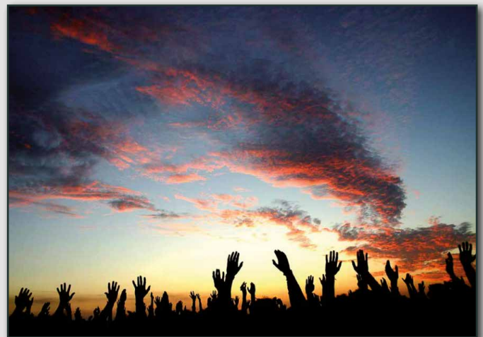
_Fig. 1 - Encontro dos Povos | Fórum Social, às margens do Rio Guaíba, RS (2005)