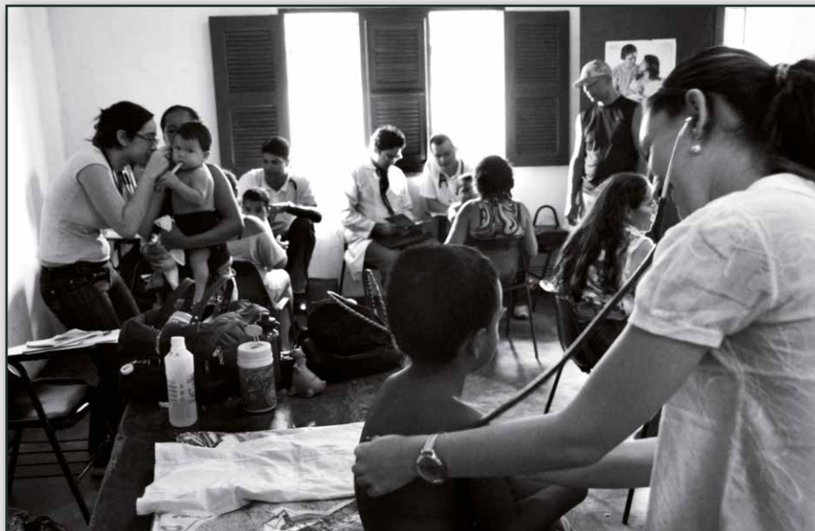
_Fig. 7 - Atendimento. Projeto Amanhecer, Posto de Saúde Romero Jucá. Fortaleza, CE (2009)

Devemos considerar as relações recíprocas entre os vários profissionais que interagem nos sistemas de saúde, por exemplo, entre enfermeiro vs. médico, médico de família vs. médico-especialista, médico e/ou enfermeiro vs. odontólogo clínico geral vs. odontólogo especialista.