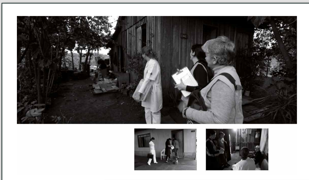
_Fig. 4 - Estratégia Saúde da Família. Foz do Iguaçu, PR (2008)

No entanto, a relação próxima e responsável entre o profissional de saúde e a pessoa envolve fenômenos psicodinâmicos presentes em qualquer relação humana, como a transferência e a contratransferência – tema que estudaremos a seguir.