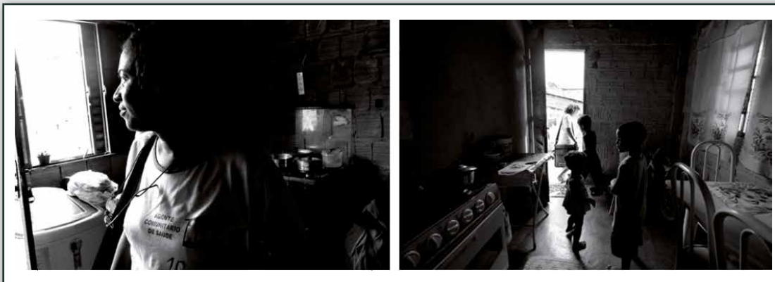
_Fig. 3 - Programa Agentes Comunitários da Saúde, visita domiciliar. Cuiabá, MT (2008)

A equipe ainda pode ser solicitada a fazer busca ativa de pessoas que abandonaram o tratamento de doenças infectocontagiosas (hanseníase ou tuberculose, por exemplo), trazidas pelo serviço de vigilância epidemiológica; ou visitas às pessoas a pedido de conselho tutelar ou ministério público. Percebe-se, portanto, a amplitude das ações acolhedoras da equipe.