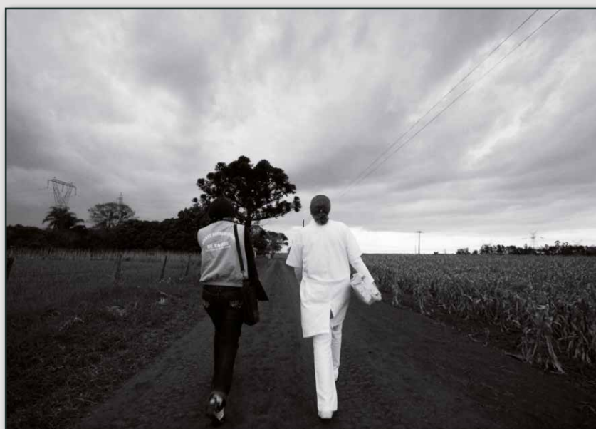
_Fig. 5 - Estratégia Saúde da Família. Foz do Iguaçu, PR (2008)

Um aspecto que frequentemente envolve a relação profissional de saúde e pessoa é a questão da distância social entre seus integrantes. Isso se expressa na possibilidade de escolha do profissional por parte do paciente. Enquanto nas camadas superiores da sociedade é possível fazer uma opção de acordo com os títulos e a reputação dos médicos ou outros profissionais, nas camadas populares isso não se aplica, daí os critérios utilizados por estes são menos específicos, como amabilidade, complacência e simpatia. Assim, em geral, o profissional pode ser percebido como membro do grupo dos patrões, professores e outros da camada dominante da população, representantes da legalidade. Isso se soma a barreiras linguísticas, diferenças lexicais e sintáticas, além do vocabulário especializado, que dificultam a comunicação entre eles. Esses ingredientes propiciam o desenvolvimento de preconceitos e desconfiança que devem ser evitados (BOLTANSKI, 1984).