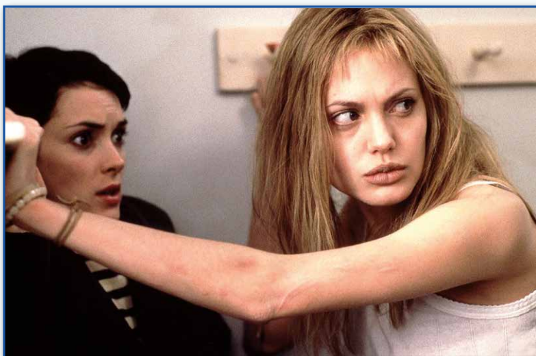
Cena do filme Garota, interrompida , de 2000. Em destaque, a personagem interpretada por Angelina Jolie, uma jovem cujo transtorno de conduta é a regra.

O maior problema para a constatação da violência doméstica é sua apresentação dissimulada. Crianças agredidas são levadas aos prontos-socorros como se tivessem passado por acidentes domésticos. O mesmo ocorre com mulheres espancadas, que pouco procuram ajuda e são surpreendidas pelos vizinhos e familiares com hematomas, muitas vezes no rosto, mas que geralmente protegem maridos (ou filhos, que também são agressores comuns), perpetuando o ciclo da violência.