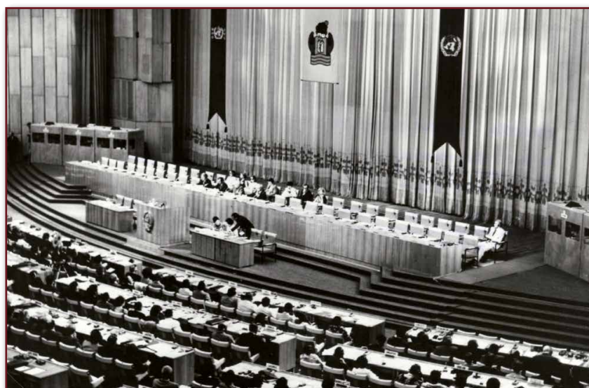
_Fig. 1 - Conferência de Alma-Ata, na antiga União Soviética, Organização Mundial da Saúde, 1978.

Assim, durante a Conferência que culminou com a Declaração de Alma-Ata, organizada pela OMS em 1978, na antiga União Soviética, a saúde foi reconhecida como direito fundamental das pessoas e comunidades, sendo enfatizado o acesso universal aos serviços de saúde e a intersectorialidade das ações, e ficando evidenciada a APS como estratégia básica para a consecução desses objetivos (MELLO, 2009). O lema Saúde para Todos no ano 2000 foi o mote das discussões, o qual seria alcançado pelo desenvolvimento da APS e seus princípios em todos os países do mundo. A Figura 1 a seguir traz uma imagem panorâmica da Conferência de Alma-Ata, em 1978.