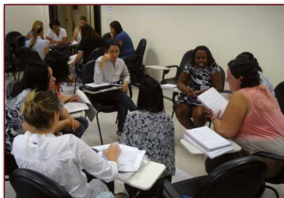
_Fig. 3 - Encontro presencial do projeto UnA-SUS/Unifesp

Observe que o desenvolvimento do trabalho em equipe não se constitui em um processo simples. As mudanças ocorridas na modernidade, a globalização das doenças, das práticas em saúde e dos hábitos de vida exigem que cada profissional se atualize constantemente para que possa efetivamente atuar em um projeto que envolva a equipe. Assim, os Ministérios da Saúde, da Educação e da Ciência e Tecnologia lançaram mão de estratégias que dessem conta desses desafios.