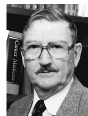
Van Rensselaer Potter

Van Potter estava preocupado com a dimensão que os avanços da ciência, principalmente no âmbito da biotecnologia, estavam adquirindo. Assim, propôs um novo ramo do conhecimento que ajudasse as pessoas a pensar nas possíveis implicações (positivas ou negativas) dos avanços da ciência sobre a vida (humana ou, de maneira mais ampla, de todos os seres vivos). Ele sugeriu que se estabelecesse uma “ponte” entre duas culturas, a científica e a humanística, guiado pela seguinte frase: “Nem tudo que é cientificamente possível é eticamente aceitável”.