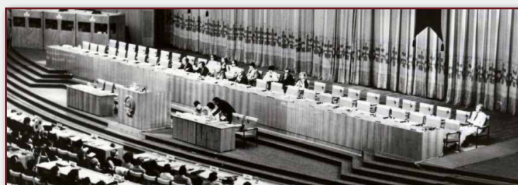
_Fig. 1 - Conferência de Alma-Ata, na antiga União Soviética, Organização Mundial da Saúde, 1978.

Assim, durante a Conferência que culminou com a Declaração de Alma-Ata, organizada pela OMS em 1978, na antiga União Soviética, a saúde foi reconhecida como direito fundamental das pessoas e comunidades, sendo enfatizado o acesso universal aos serviços de saúde e a intersectorialidade das ações, e ficando evidenciada a APS como estratégia básica para a consecução desses objetivos (MELLO, 2009). O lema Saúde para Todos no ano 2000 foi o mote das discussões, o qual seria alcançado pelo desenvolvimento da APS e seus princípios em todos os países do mundo. A Figura 1 a seguir traz uma imagem panorâmica da Conferência de Alma-Ata, em 1978.