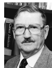
Van Rensselaer Potter

Van Potter estava preocupado com a dimensão que os avanços da ciência, principalmente no âmbito da biotecnologia, estavam adquirindo. Assim, propôs um novo ramo do conhecimento que ajudasse as pessoas a pensar nas possíveis implicações (positivas ou negativas) dos avanços da ciência sobre a vida (humana ou, de maneira mais ampla, de todos os seres vivos). Ele sugeriu que se estabelecesse uma “ponte” entre duas culturas, a científica e a humanística, guiado pela seguinte frase: “Nem tudo que é cientificamente possível é eticamente aceitável”.