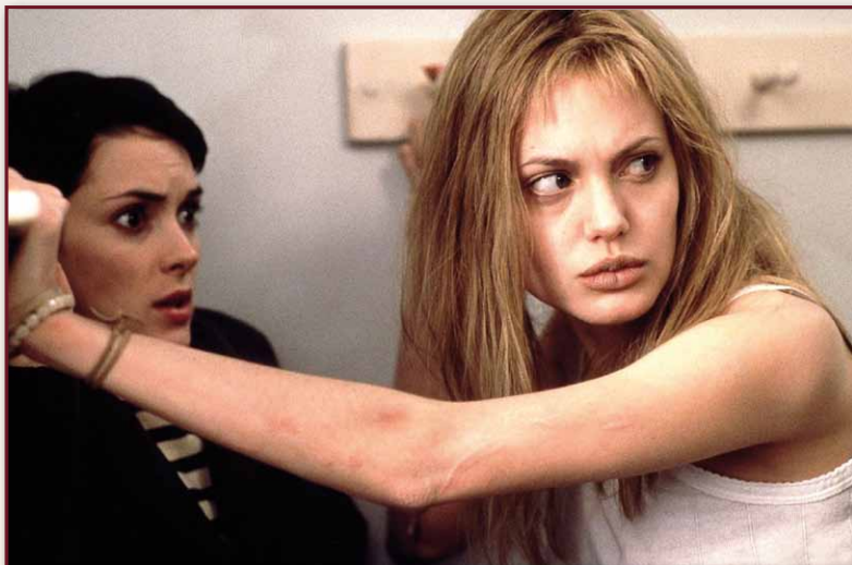
Cena do filme Garota, interrompida, de 2000. Em destaque, a personagem interpretada por Angelina Jolie, uma jovem cujo transtorno de conduta é a regra.

Anteriormente conhecido como transtorno de conduta passivo, o transtorno de conduta passou de uma questão moral ou comportamental para um problema de saúde, não mais sendo visto apenas por sua ligação ao delito, ao crime. Mais do que travessuras em série, dada a gravidade dos atos, o transtorno de conduta é reconhecido pela ausência de crítica do agressor, pela incapacidade do agressor de perceber que seu comportamento viola a liberdade do outro. São frequentes, naquele que provoca a violência, demonstrações de frieza, irritabilidade, mudanças súbitas de humor, intolerância às mínimas frustrações e a atribuição da responsabilidade ao agredido pelo próprio abuso, como se este o merecesse.