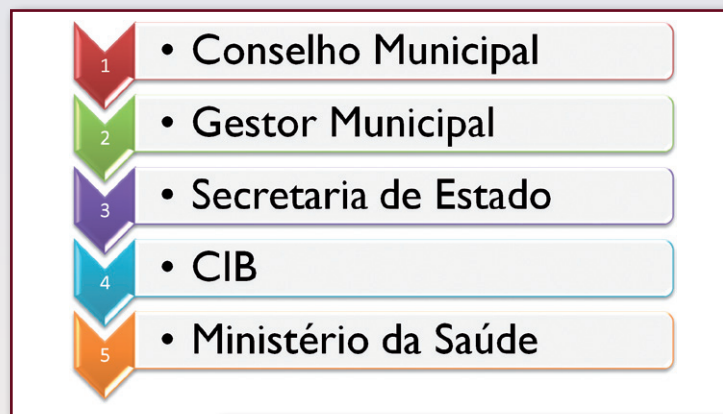
_Fig. 1 - Passos de implantação da ESF